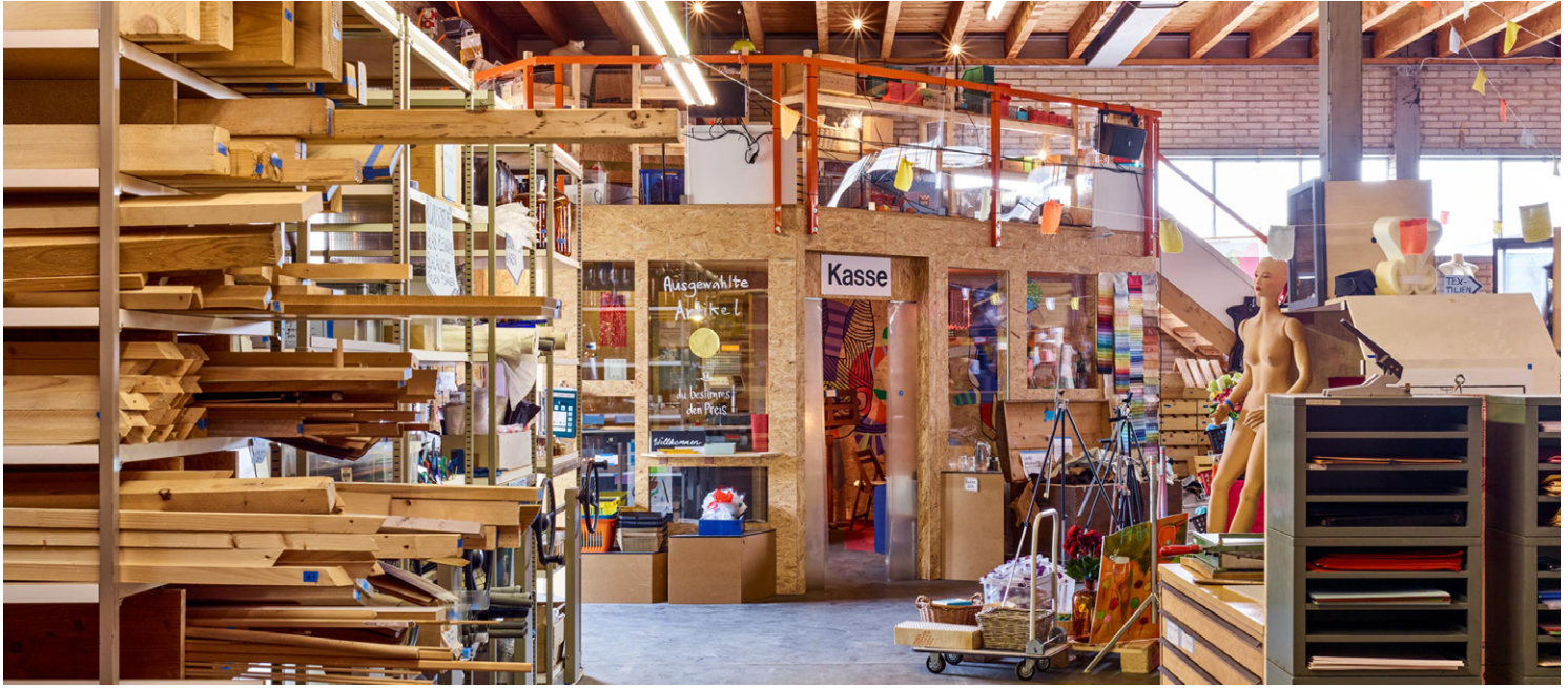
Gestaltung des Kasseneinbaus im Materialmarkt OFFCUT. Massivholz, Glas, OSB. Sonderanfertigung, 2014