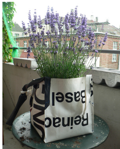
Pflanzentopf hängend. Einzelstück, 2007