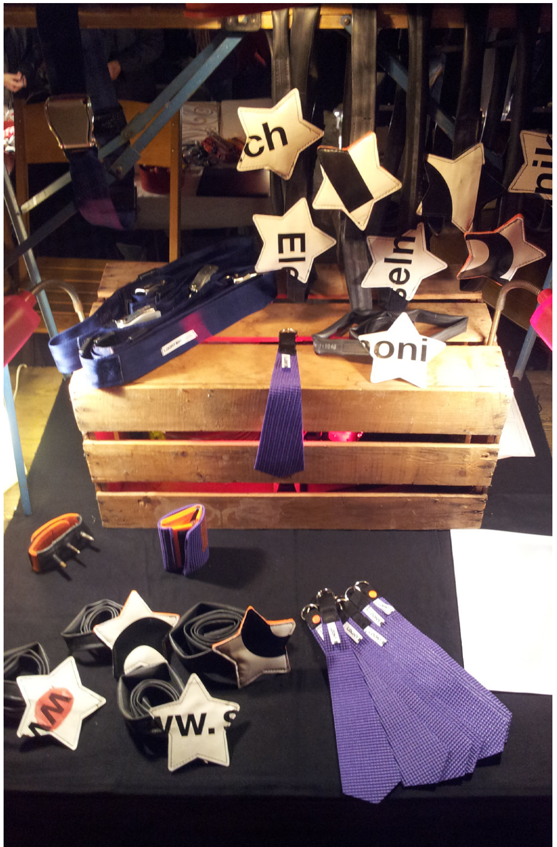
Verkaufsstand Nachtmarkt Baden, 2011