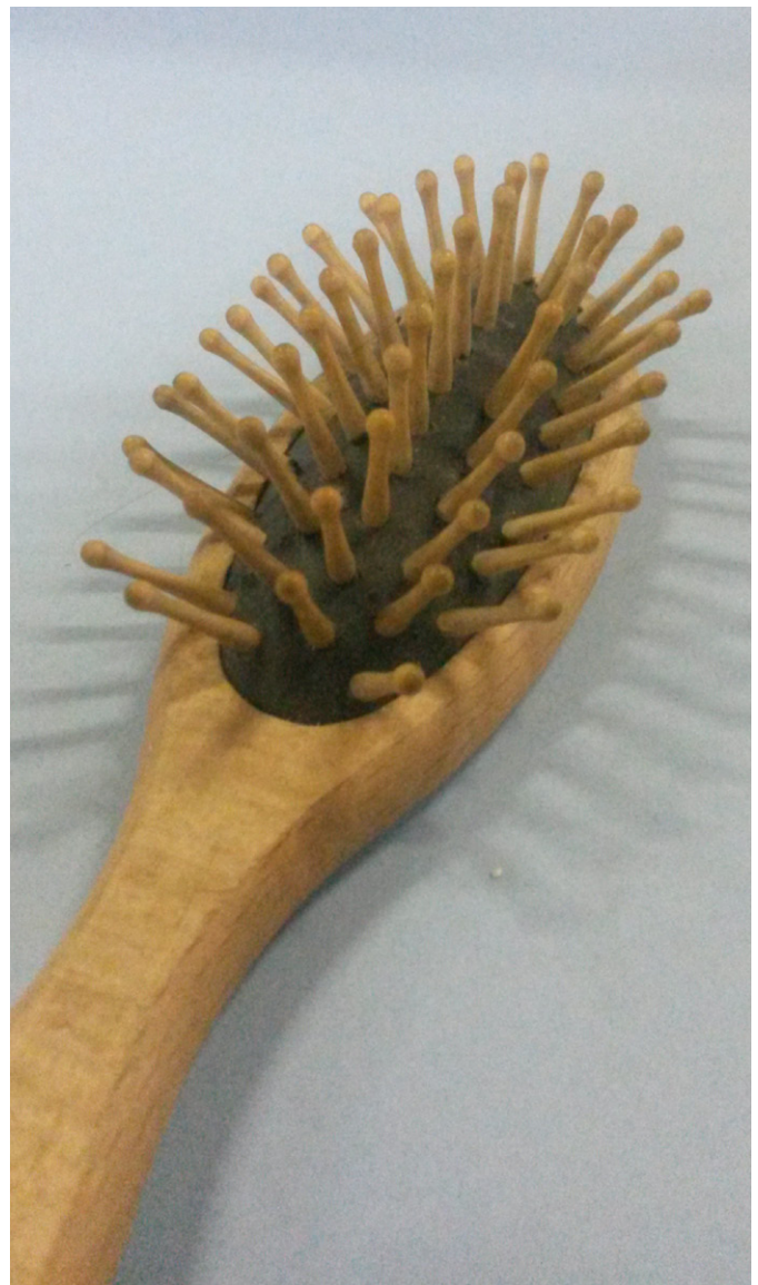
Reparaturleistung bei einer Haarbürste, Wiederverwertete Materialien. Einzelstück, 2018