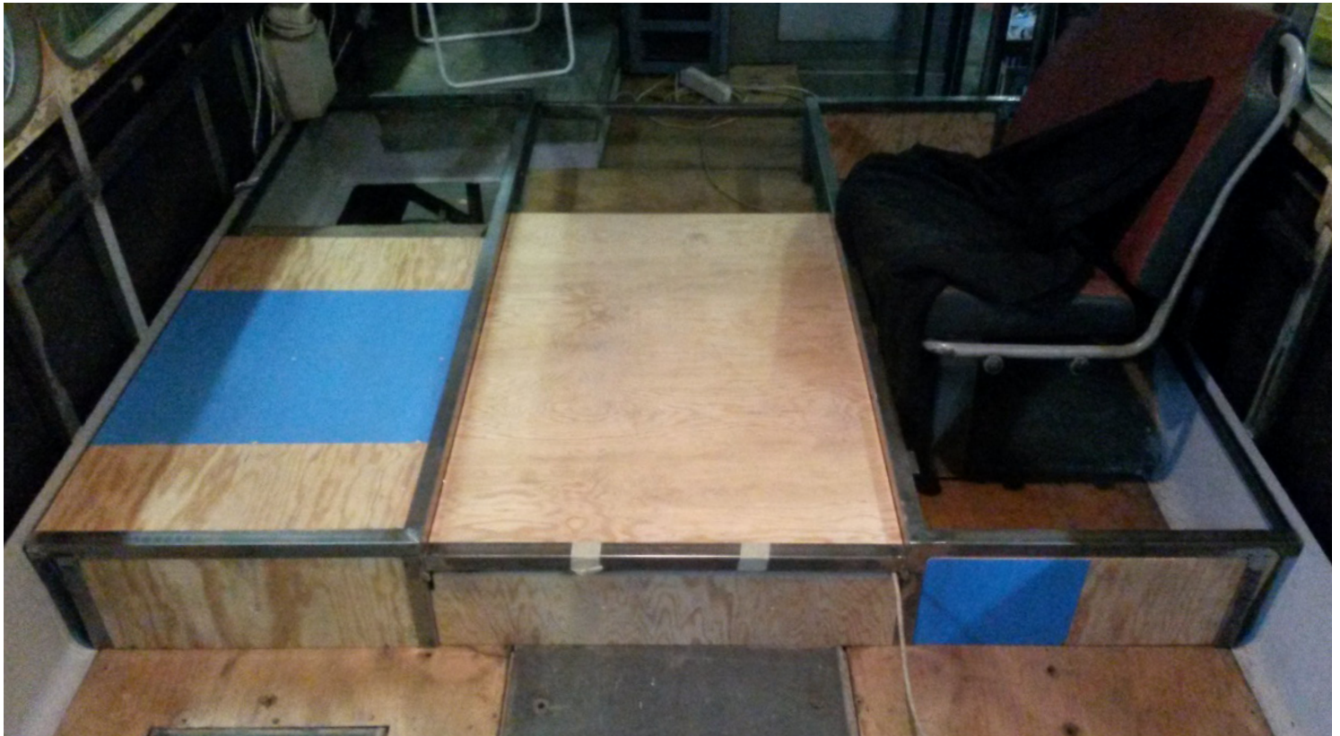
Unterkonstruktion für cartouche, abgebildet: Testinstallation. Blankstahl, geschweisst, später lackiert; Multiplex. Sonderanfertigung, 2016-17