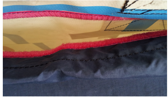
Wäschekorb aus Plane, Synthetikmaterial und Klettverschluss. Einzelstück, 2011