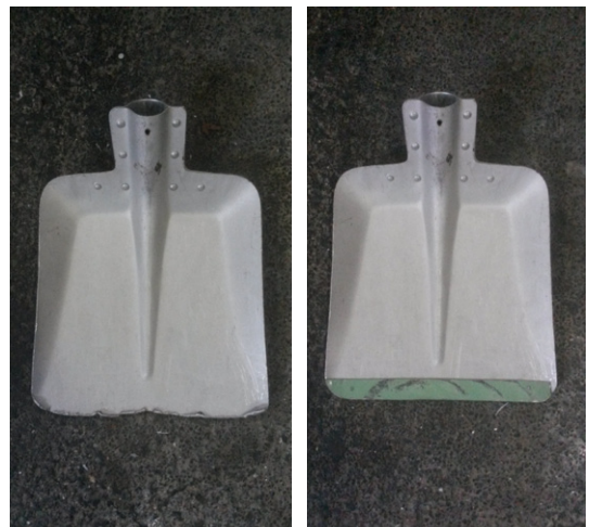
Reparaturleistung bei einer Schneeschaufel, Wiederverwertete Materi- alien. Einzelstück, 2018