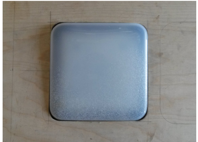
Design der Deckenleuchte für cartouche, abgebildet: Praxistests. Plexiglas, tiefgezogen. Kleinserie, 2017-18