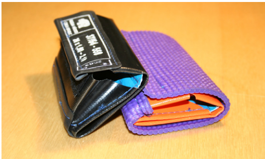
Portemonnaie aus Plane, Fahrrad- schlauch, Yogamatte. 90% wieder- verwertete Materialien. Mehrere Einzelstücke, 2007-2015 & 2018