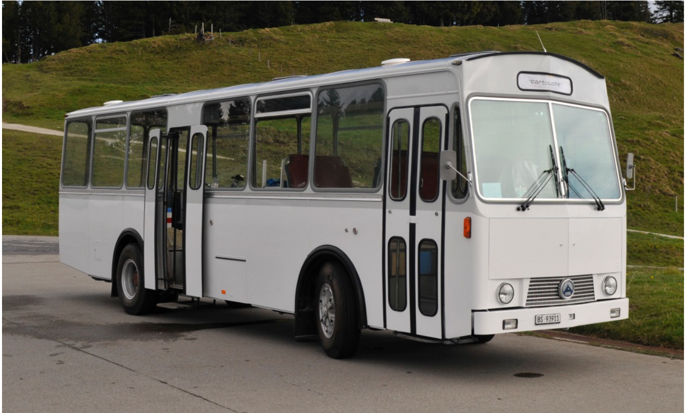
Abgeschlossene Neulackierung, cartouche. Sonderanfertigung, 2017