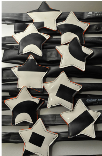
Gürtel aus Fahrrad- schlauch, Filz und Plane. 90% wiederverwertete Materialien. Kleinserie, 2009