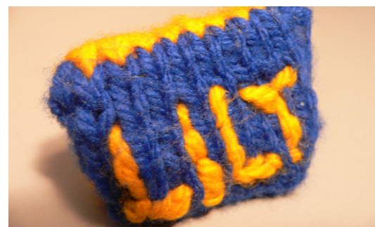
Mini-Portemonnaie, gestrickt. Einzelstück, 2006