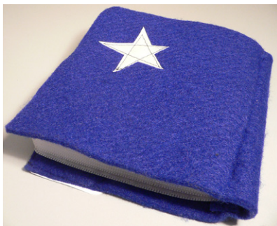
CD-Einband. Einzelstücke, 2006