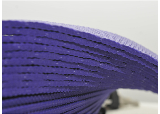
Schlüsselanhänger aus Yogamatte. Kleinserie, 2009