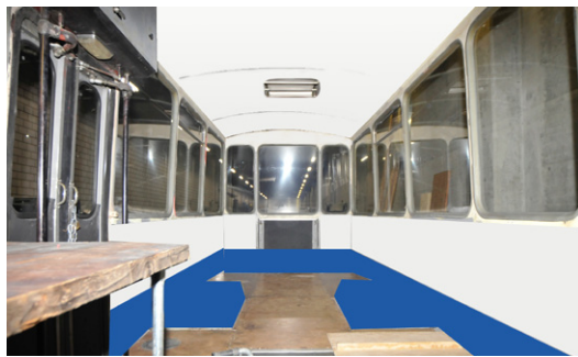
Letzte Visualisierungen, Farbgebung für cartouche. Sonderanfertigung, 2017-18